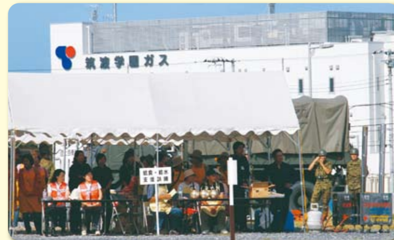
地域自治体と自衛隊も参加して

お客様の個人情報は、当クイズの抽選管理に利用させていただく他、イベントのご案内、ガス機器の情報提供など、お客さまにとって有益な情報をご案内する目的で利用させていただきます。筑波学園ガス株式会社が適切に管理させていただきますので、ご了承ください。