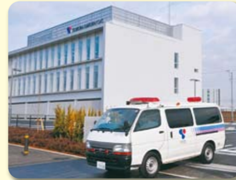
一刻でも早く出動する緊急出動車

万一の災害に備えて、 365日24時間の受付、 緊急出動体制を整えて お客様の保安の確保に 努めております