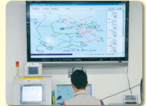
24時間監視体制による保安の確保

万一の災害に備えて、 365日24時間の受付、 緊急出動体制を整えて お客様の保安の確保に 努めております