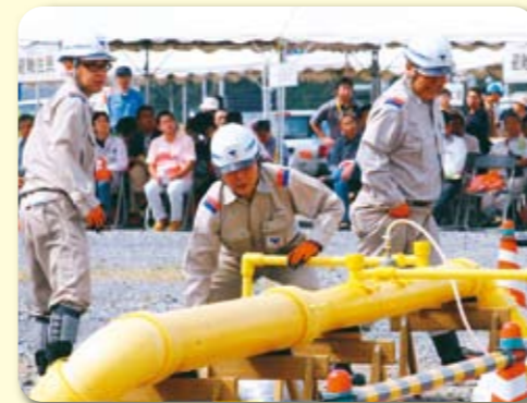
地震に強いガス管(ポリエチレン管)の敷設