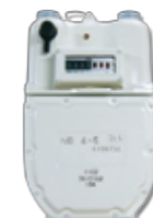
震度5以上で作動するマイコンメータ